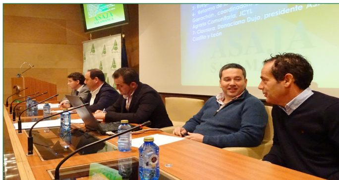
La Junta Directiva de ASAJA Salamanca