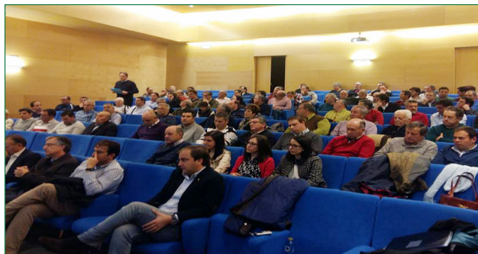
Un momento, en el turno de 'Ruegos y preguntas'.