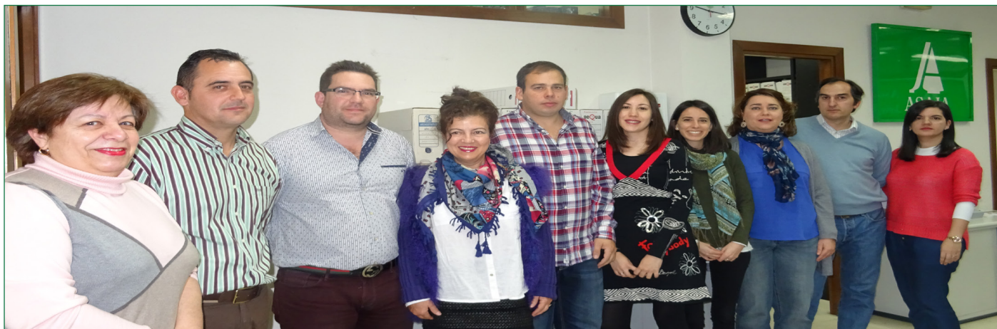
Equipo de profesionales que componen la organización salmantina.

una mirada crítica y respetuosa ante todos los entes económicos y sociales. Vela, especialmente, por la incorporación de los jóvenes y las mujeres a la actividad en un medio, el rural, pilar fundamental de la organización. Asimismo, es imprescindible dotar de la acción aseguradora de la OPA, que, en esta campaña de siembra de la remolacha, se hace más que necesaria la contratación de la Línea 326 para dar cobertura de no nascencia al cultivo pues posiblemente sea uno de los siniestros que se produce con mayor frecuencia. ASAJA Salamanca ofrece un amplio abanico de servicios tanto a asociados como no, y con la garantía de estar en manos de los mejores profesionales. Porque sentirse parte de una organización agraria que, desde la independencia de los poderes políticos y económicos, defiende de una forma profesional los intereses es la mejor apuesta de futuro.