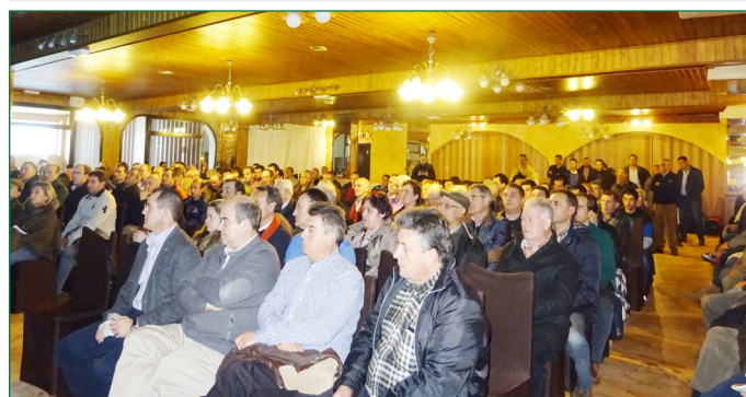
El público abarrotó el salón