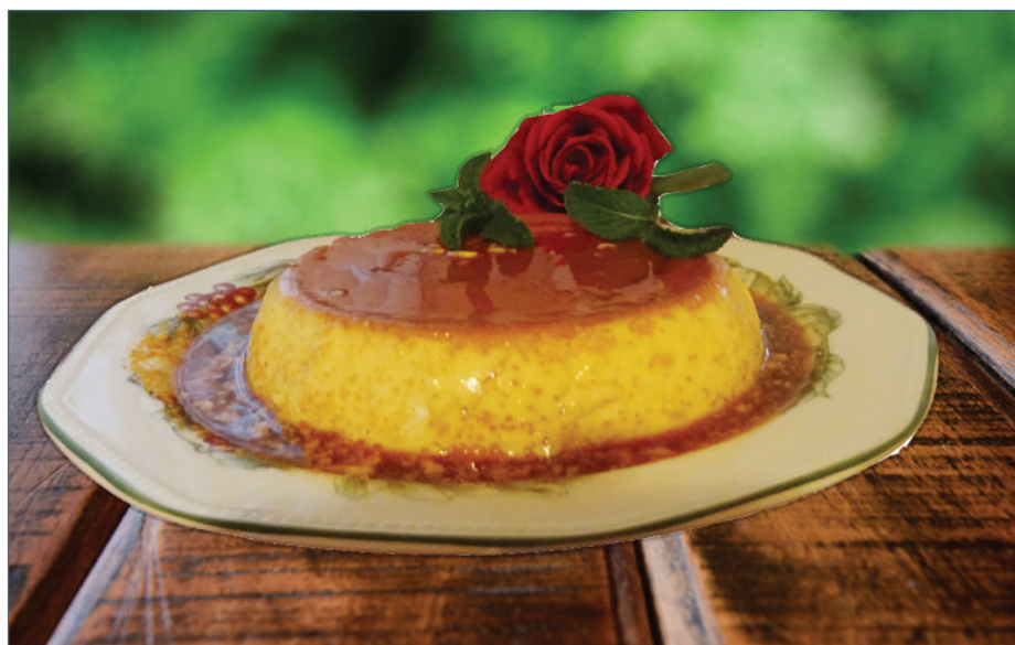
Flan elaborado con huevos de gallinas 'al aire' de la comarca de Ciudad Rodrigo.

**El producto estrella de esta semana son los huevos de gallina 'al aire' . Los hemos denominado así aunque todos sabemos que se tratan de 'al aire libre'. En mi caso, los he seleccionado de la zona de Ciudad Rodrigo, concretamente de Bocacara, cuyas gallinas se alimentan de todo. Los beneficios de escogerlos así y no los que se compran en hipermercados son muchos. La alimentación de la gallina lleva muchos complementos naturales: semillas, plantas verdes, insectos, gusanos... Todo ello hace que el huevo sea más nutritivo y que contenga: 1/3 menos de colesterol, 2/3 más de vitamina A, tres veces más de vitamina E, 1/4 menos de grasas saturadas, dos veces más omegas 3, siete veces más de beta carotenos. Se distinguen por el color naranja brillante de la yema.