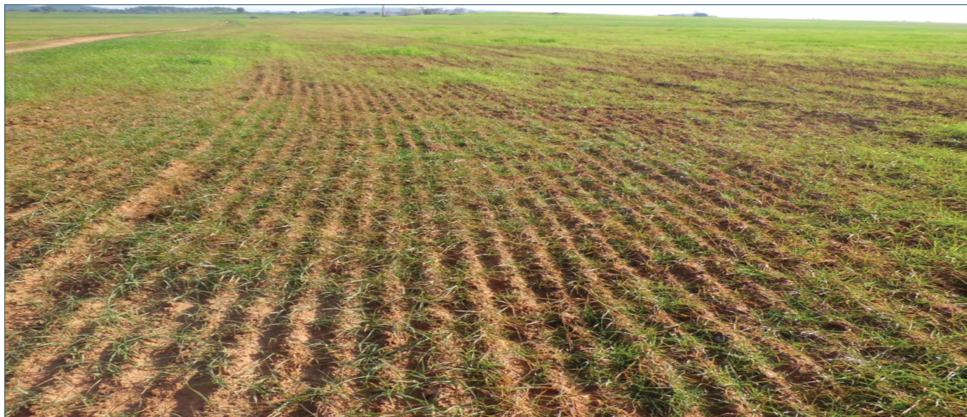
Heladas y sequía provocan graves daños en el campo de la Región.

Una vez recibido el siniestro, el perito se personará en la explotación lo antes posible para llevar a cabo la valoración.