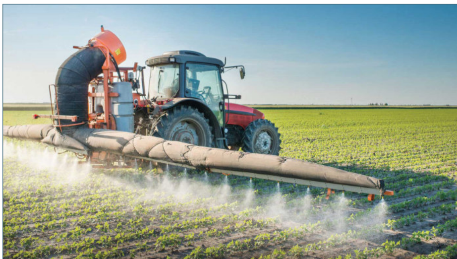
Maquinaria de aplicación de productos fitosanitarios.

La Guardia Civil, en colaboración con la Consejería de Agricultura y Ganadería de la Junta de Castilla y León, procederán durante el mes de mayo en