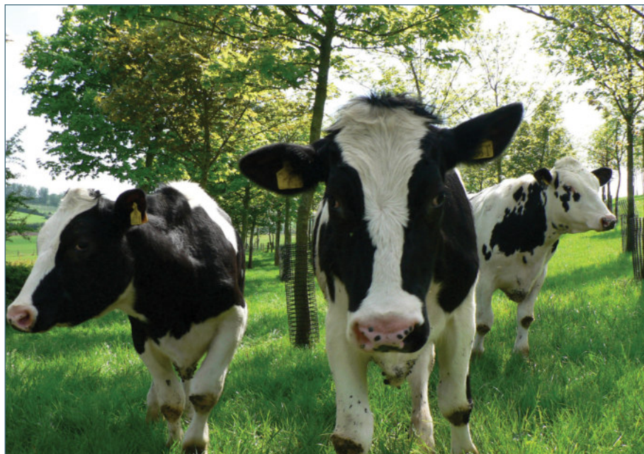
Reses, potenciando la silvicultura.

Las ayudas se pagarán con cargo a la aplicación presupuestaria y cuantía de los Presupuestos Generales de la Comunidad de Castilla y León para el año 2017 con un importe total de 1.000.000 de euros. La fecha límite para que los beneficiarios realicen sus peticiones se alargará hasta el 1 de julio.