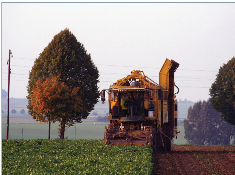
Agricultores, realizando labores de cosecha de remolacha azucarera.