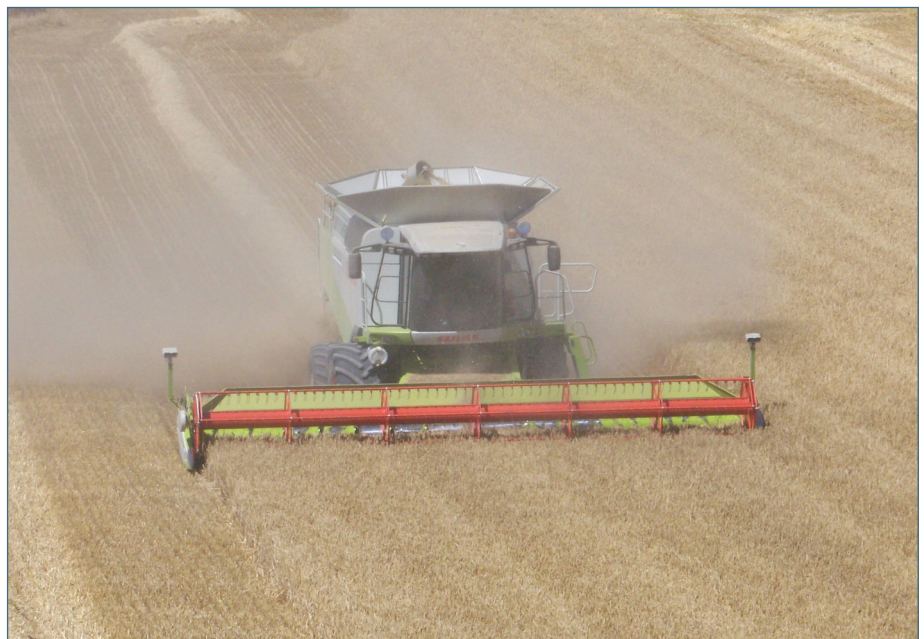
Es fundamental adaptar los cultivos declarados en el seguro a la PAC.

Seguro de RC de la maquinaria. Del mismo modo que un siniestro de daños propios puede hacer que nuestra máquina pase a tener un valor 0, las consecuencias de un siniestro causado a una tercera persona pueden ser imprevisibles e incuantificables, por ello, es fundamental disponer de un buen seguro de responsabilidad civil en función del uso que se haga de dicha máquina. Este aspecto en demasiadas ocasiones está mal planteado o sus capitales para el caso de incendio, son irrisorios. No dudéis en pedirnos condiciones del mismo modo que con otro tipo de seguros. Contamos con vosotros.