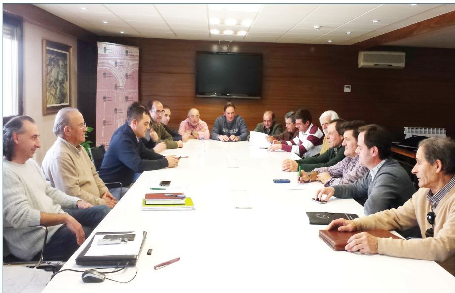
Sesión de diálogo del frente común.

1.- El ganadero, parte fundamental del proceso, debe estar personalmente informado de todo lo que se realiza