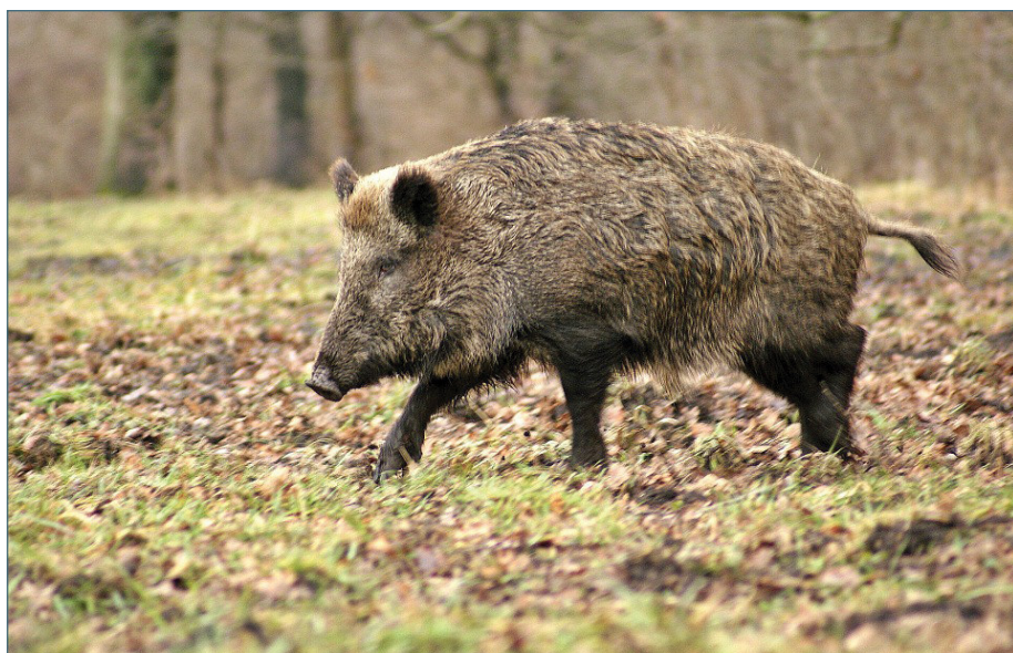
El colectivo pide más medidas de control para la fauna silvestre.

10.- Los baremos de indemnización deben llegar al precio de mercado del animal sacrificado y, además, debe tenerse en cuenta el lucro cesante que supone restricciones de movimiento ante la retirada de la calificación sanitaria.