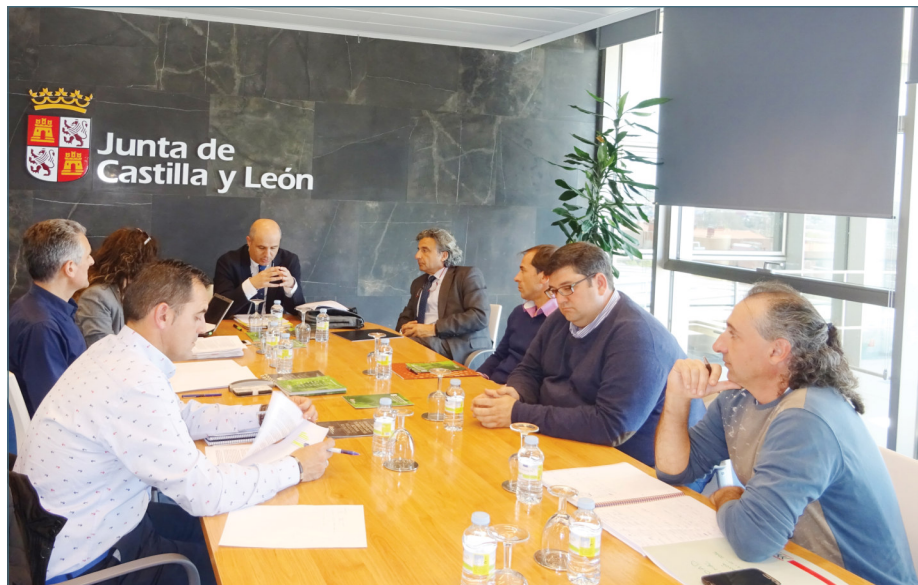
Una imagen de la reunión del colectivo con la Dirección General de Producción Agropecuaria.

Entre otras cuestiones, el colectivo se quejaba de la falta de información que recibía el ganadero y la Junta declaró en la reunión que, “aparte de informar personalmente como ya se