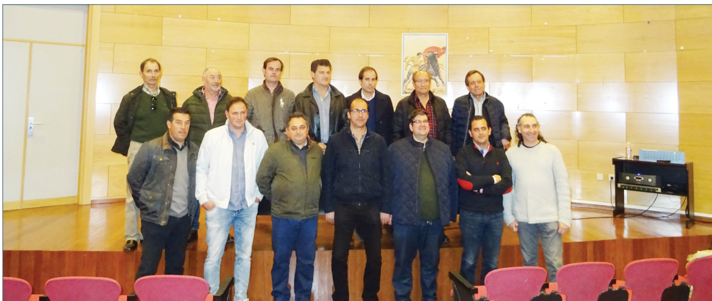
Las organizaciones y los principales colectivos ganaderos, unidos.

diferentes códigos de reproducción o pastos y ceban agrupados todos sus terneros en otro código de cebo donde poseen sus instalaciones adecuadas; por ello, impedir el movimiento de estos animales provoca que sus explotaciones sean inviables y, además, no está justificado sanitariamente. Es imprescindible autorizar el movimiento de los ejemplares aunque sea con unas garantías o controles suplementarios.